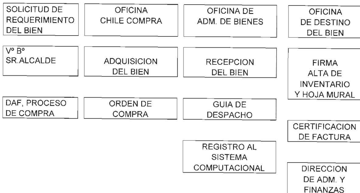
DIAGRAMA 1: ADQUISICIÓN DEL BIEN

Artículo 20.- A continuación se muestran 2 diagramas de flujo que grafican los pasos a seguir cuando se trate de adquirir bienes (procedimiento de Alta) y cuando se trate de dar de Baja.